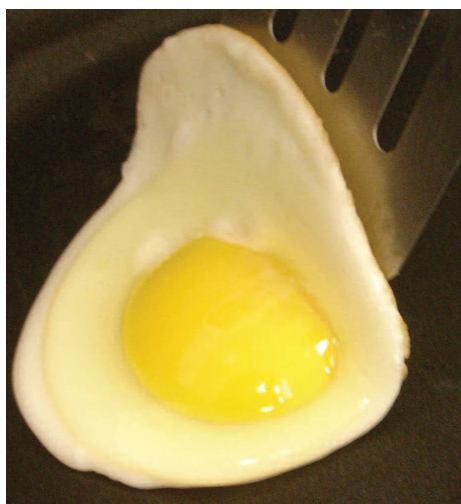
El huevo frito no debe pegarse y se debe despegar fácilmente sin dejar huella para calificar como un "pase".

• El brillo se ha más que duplicado, pasando de 10 a >20 comparado con reves-